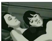
Fear me not