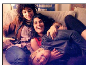
La rupture était presque parfaite