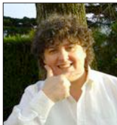
Patry signe « lesbiennes »

Pour une rencontre entre sourdes et entendantes