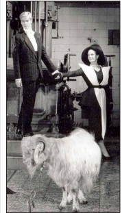
Veruschka von Lehnendorff et Delphine Seyrig dans Dorian Gray d'Ulrike Ottinger, 1984