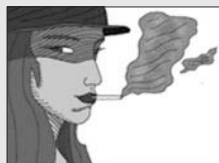
La Grande Alice