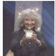
Ulrike Ottinger et son Teddy d'honneur à la Berlinale 2012